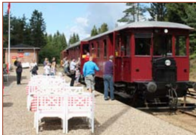
Vrads station med sommertog.

Siden blev banens tracé til natursti, bortset fra strækningen mellem Bryrup og Vrads hvor der i over 40 år har været veteranbane.