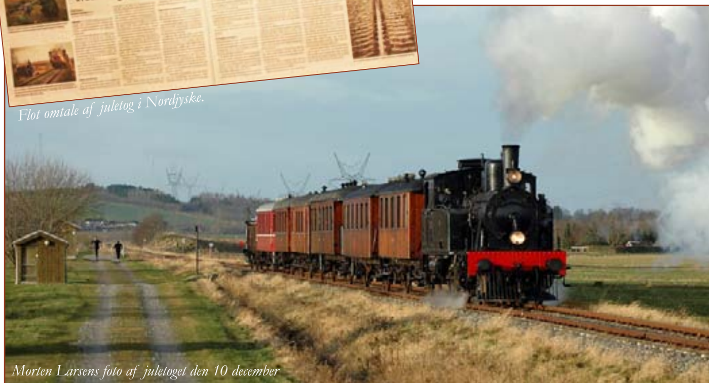
Morten Larsens foto af juletoget den 10 december