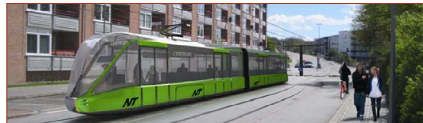
Fotomontage af letbanetogsæt i Bornholmsgade

Første etape af det mulige letbanetrace mellem Sohngårdsholmsvej og busvejen i Universitetsområdet åbner i slutningen af 2012 som busvej.