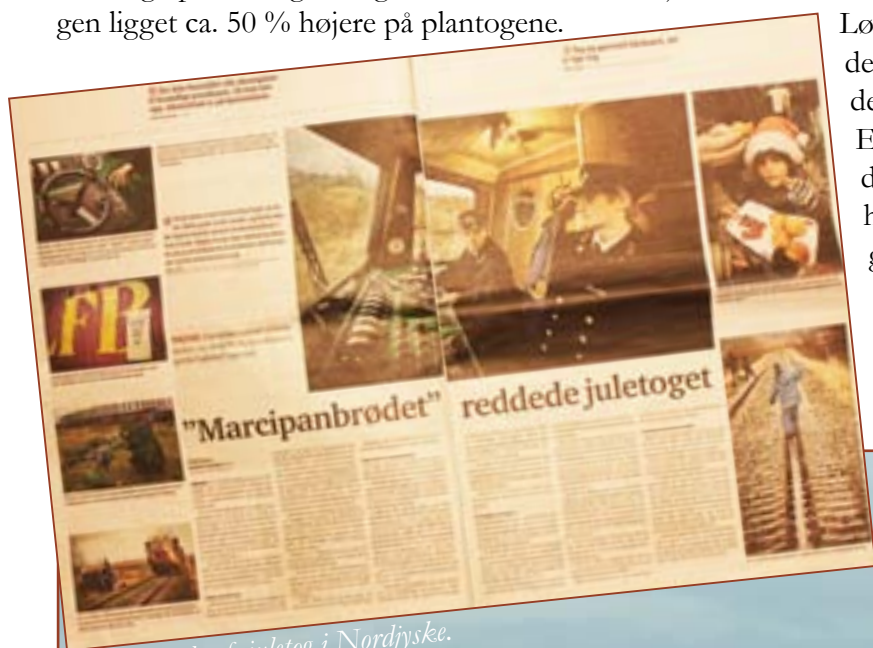
Flot omtale af juletog i Nordjyske.