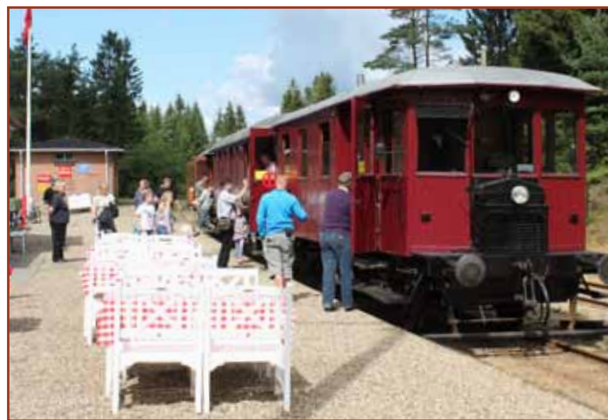
Vrads station med sommertog.

Siden blev banens tracé til natursti, bortset fra strækningen mellem Bryrup og Vrads hvor der i over 40 år har været veteranbane.