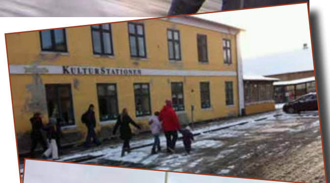
Foto fra julekørslen i 2012

Billetter kan købes i forsalg den 28. november og 4., 5. december kl. 14.00 - 17.00. Forsalget finder sted på Forchhammersvej 7, 9000 Aalborg (nær Sygehus Syd). Resterende billetter sælges ved toget før afgang og på mellemstationerne.