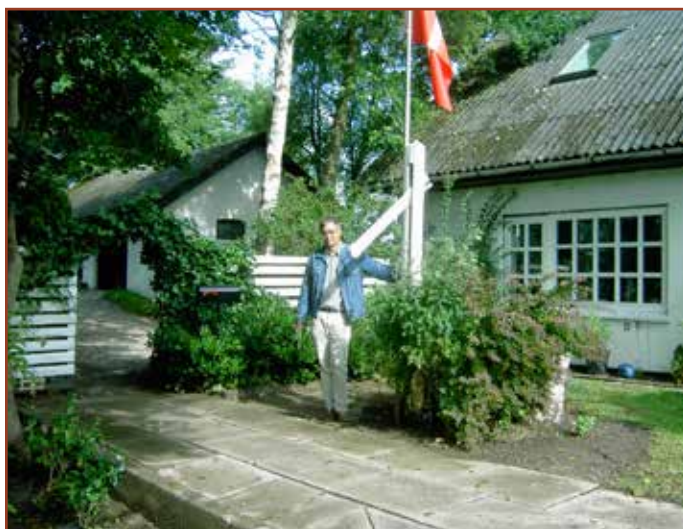
Trinbrætssignalet ved Sønderholm station

http://www.aalborgkommune.dk/kultur-og-fritid/Natur/Aktivt-friluftsliv/Documents/Bjergbanestien/Bjergbanestien-folder-lille-pdf.pdf