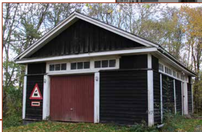
Pakhus ved Sdr. Saltum.