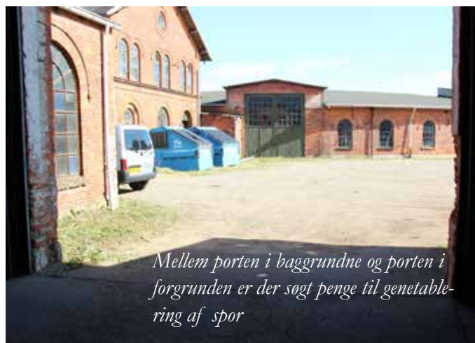
Mellem porten i baggrundne og porten i forgrunden er der søgt penge til genetablering af spor

Der er endvidere søgt støtte til renovering af spor 1-7, der aldrig er renoveret. Der er endvidere søgt støtte til genskabelse af spor fra ringremisen til nyt værkstedsløj og de 500 kvadratmeter i "Aalborg Privatbaners værksted" som i dag ejes af Toppenbergs Maskinfabrik.