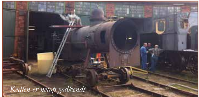
Kedlen er netop godkendt