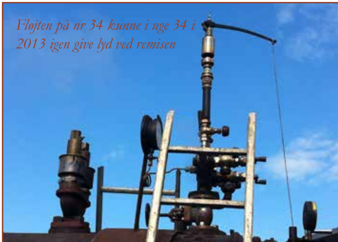
Flojten på nr 34 kunne i uge 34 i 2013 igen give lyd ved remisen