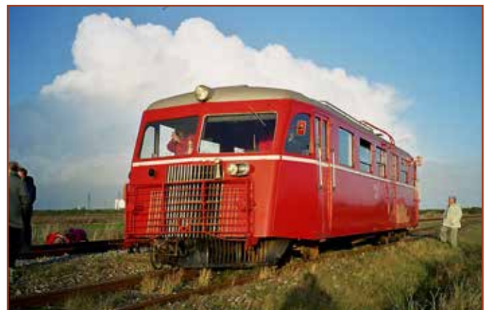
Sm 7 i 2002 på sin sidste tur inden motoren døde.