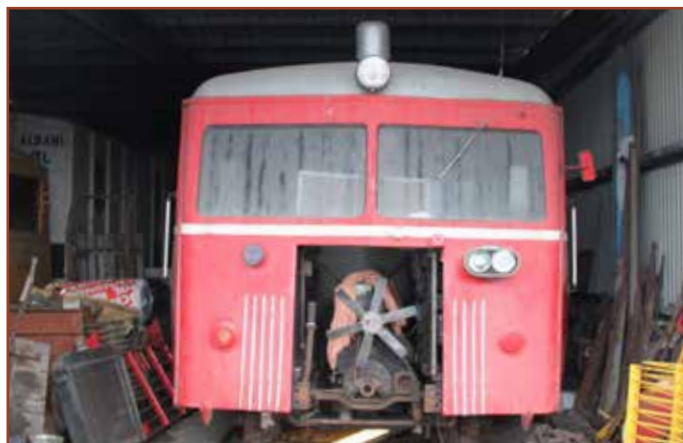
Sm 7 i foråret 2013. Motoren på vej ud til vurdering.