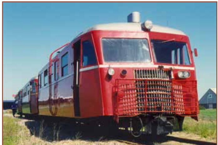
Sm 7 nymalet i 1994.

Det skønnes at skinnebussen vil kunne være i drift til sommeren 2014, hvis vi får det søgte beløb.