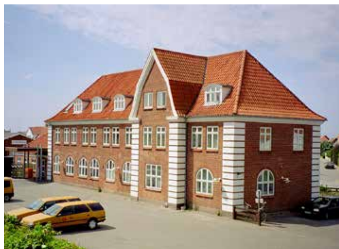
Løkken station som den ser ud i dag.

Der arrangeres samkørsel så tilmelding er nødvendigt til Limfjordsbanen@stofanet.dk senest den 1. november, så vi får et overblik over ledige pladser i bilerne.