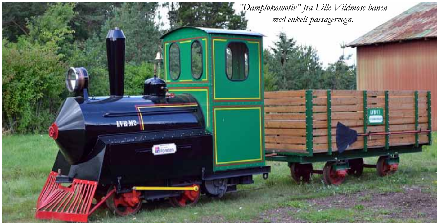
"Damplokomotiv" fra Lille Vildmose banen med enkelt passagervogn.