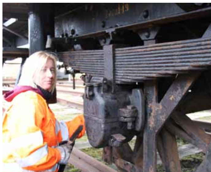
Og der blev banket rust.