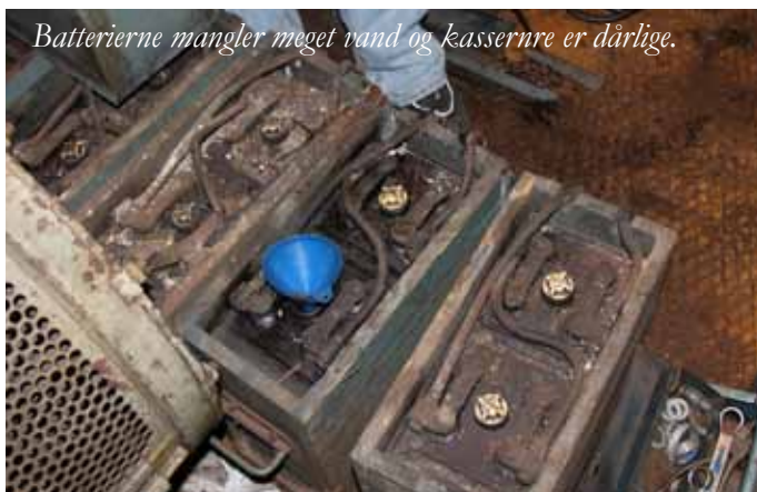
Batterierne mangler meget vand og kasserne er dårlige.

Også på 5206 er der et efterslæb i vedligeholdelse og der har været lavet uheldige ting. Der har været proppet fedt ned til banemotorerne, hvilket har været et større arbejde med at få rensat af igen. I forbindelse med revisionen næste år skal banemotorer renses totalt. Kuleftersyn er foretaget på kompressor og hoveddynamo. Kullene kunne næsten ikke køre frem og tilbage som de skal kunne. Dynamoer er er blevet skrabet ud mellem lamellerne. Når disse er kortsluttet kan lokomotivet ikke magnetisere. Batterier mangler generelt vand og de er alle sendt til batterileverandør for vand og syrepåfyldning. 8 nye batterikasser er under fremstilling. Vandpumpen er under reovering idet en pakning ikke er tæt.