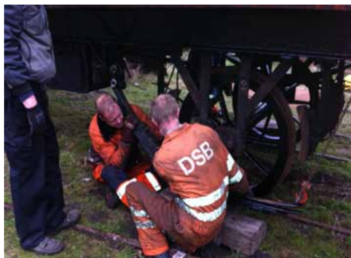
C 1 får "nye" fjedre.

SB B11 .Dørlåse efterses. Nedslibning og opmaling af vognkasse.