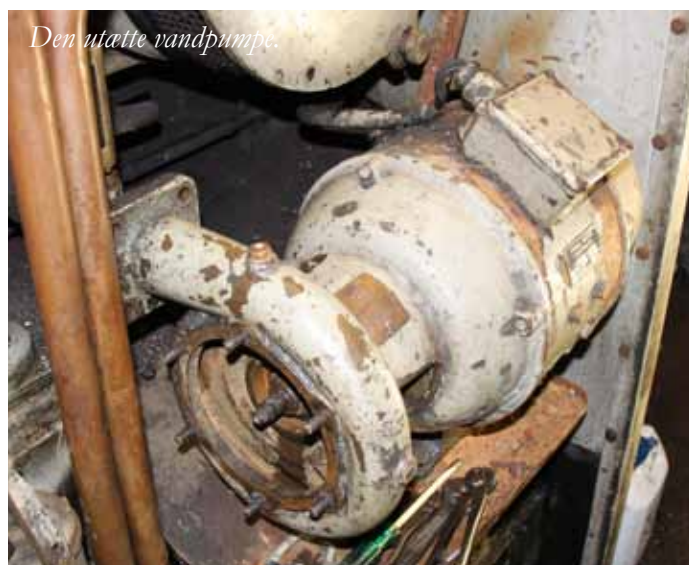
Den utatte vandpumpe.

Nyt olie er fundet til maskinen, men der kommer vand ind diverse steder. Dette skal undersøges inden der kommer nyt olie på. Batterier skal skiftes. Indtil videre er der fundet vand under topstykkerne, der sikkert er kommet ind ved ventildæksel pakning, der skal skiftes og inde ved ånde røret. Dette skal laves om ellers er der ikke fundet tegn på vandutætheder. Det undersøges om vi kan trykprøve motoren med vand på. Desværre er der kommet to frostsprængninger i centralvarme systemet på maskinen, der dog kan køre uden dette.