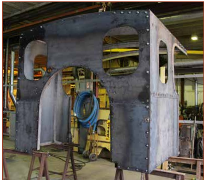
Førerhuset nærmer sig færdiggørelse