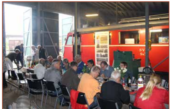
I spor 14 var kørt en vogn ud og med Sm 7 som baggrund blev der tændt op i grillen.

17. juni 1973 kørte det første tog fra Limfjordsbanen og i den anledning var der stor fest for tidligere og nuværende aktive i banen den 15. juni i remisen.