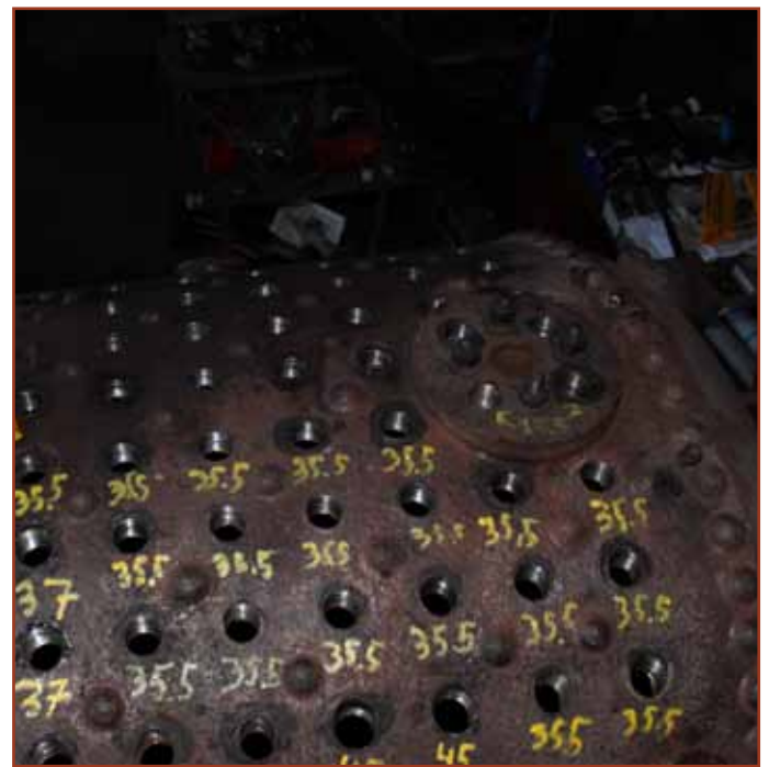
Der er lavet nyt gevind i 2/3 af hullerne til topstøtteboltene