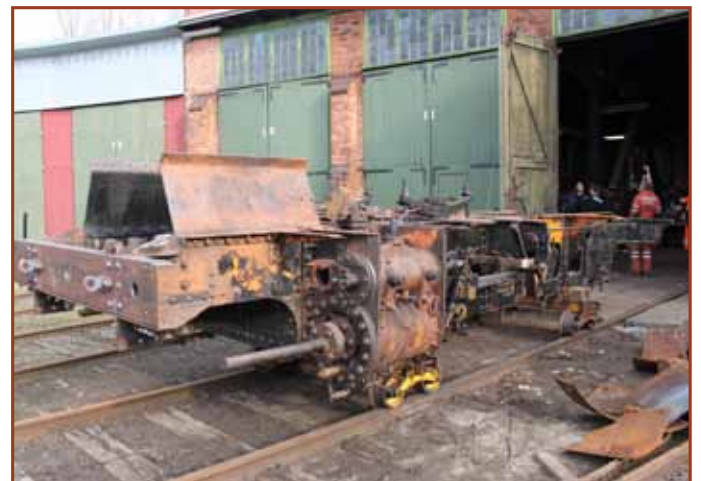
Der er søgt fondsmidler til overfladebehandling af rammen