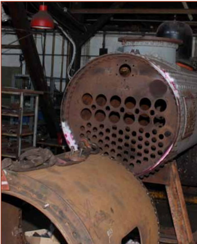
Nitter til at samle det nye røgkammer med kedlen er skaffet fra England.