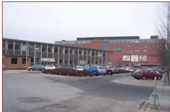
Den gamle godsterminal står nu tom

Om få måneder vil konturerne til arealets fremtidige anvendelse tegne sig, når soklen sidst i maj sættes til Aalborg Studenterkursus' nye bygning på stedet.