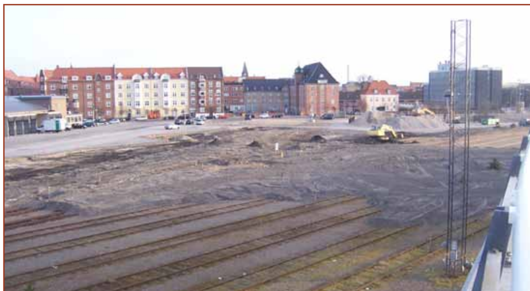
Området fotograferet fra Dag Hammarskjoldsgade. Politigården til højre og godsterminalen til venstre.

Ligeledes i foråret bliver der første spadestik til Boligforeningen Fjordblink byggeri af 175 ungdomsboliger og 35 familieboliger i den kommende campus, en betegnelse for et område med blandet bolig- og uddannelsesbyggeri.